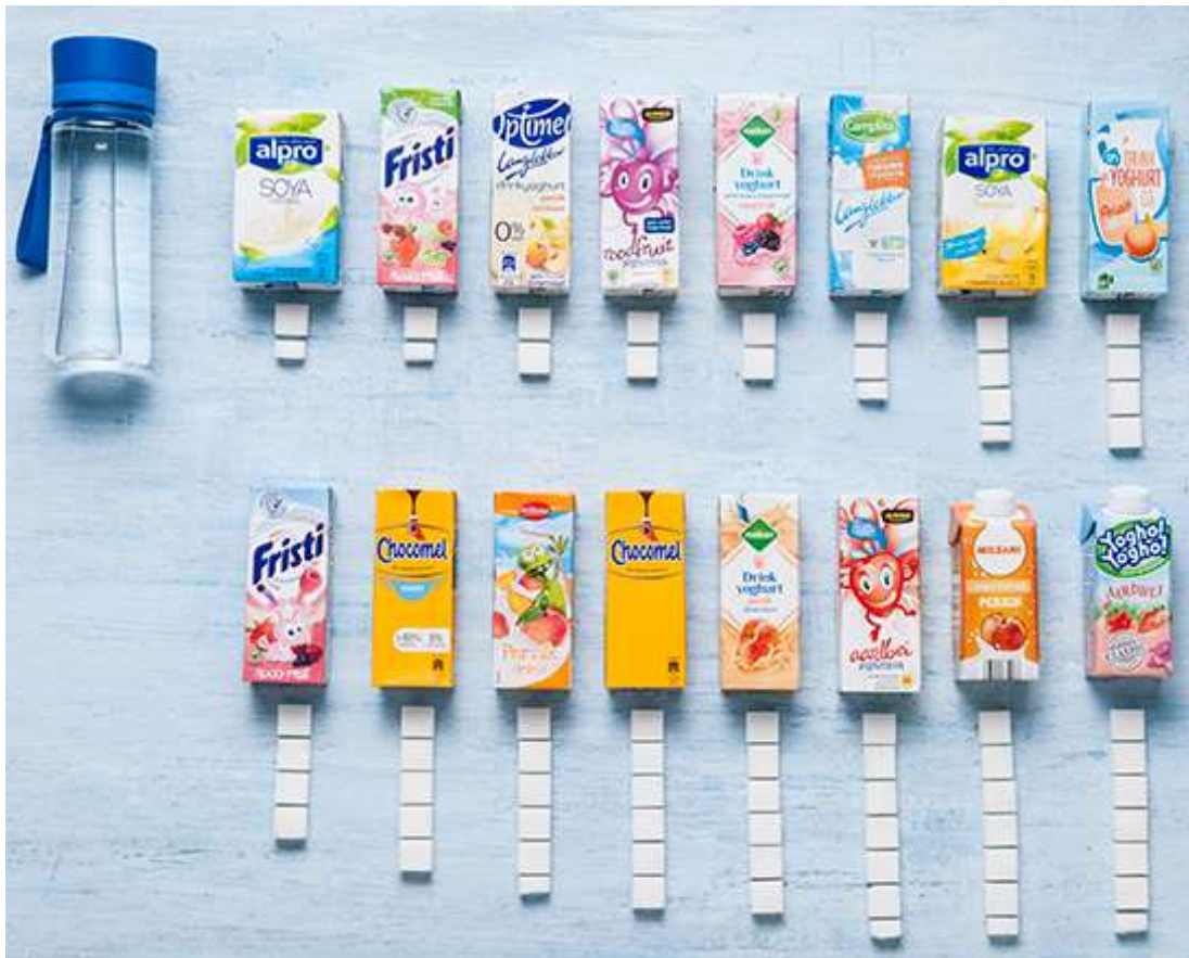
Suiker in vruchtendranken met zuivel